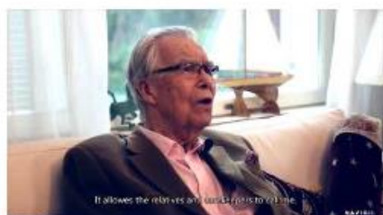
Navigil S1 Testimonial