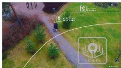
How the Navigil S1 watch phone geo- fence alarm works