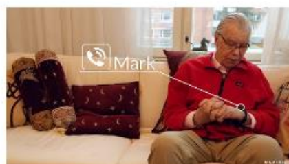
Make a voice call with the Navigil watch phone