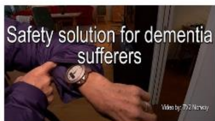
Safety watch for dementia sufferers - TV2 Norway